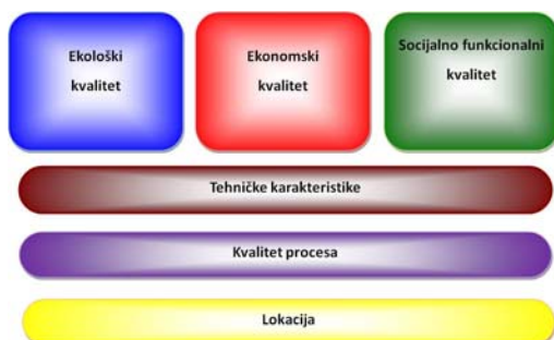
Slika 1- Osnove metodologije

Gradenje sa osvrtom na troškove tokom eksploatacionog veka objekta je ekonomska metoda