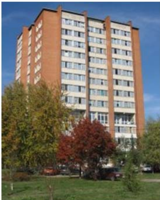
Slika 1- Izgled studentskog doma